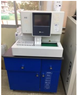
A 1 C