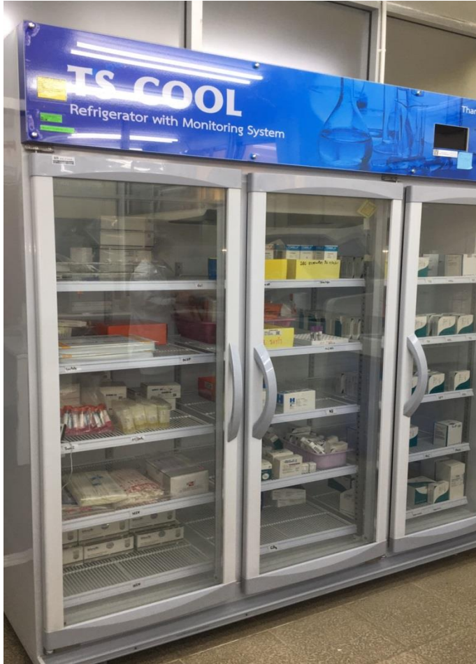
ตู้เย็นเก็บน้ำยา