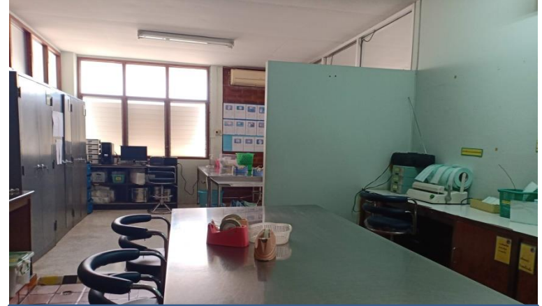
ห้องเตรียมเครื่องมือ