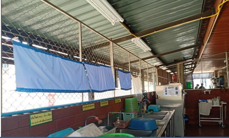
ห้องล้างเครื่องมือ