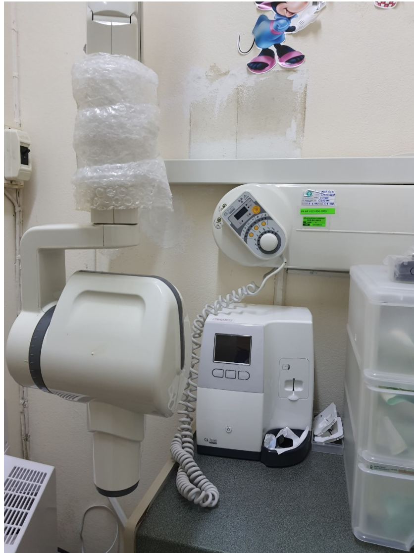
19.3 เครื่องเอกซเรย์ฟัน เลือและฉากตะกั่วกันรังสี