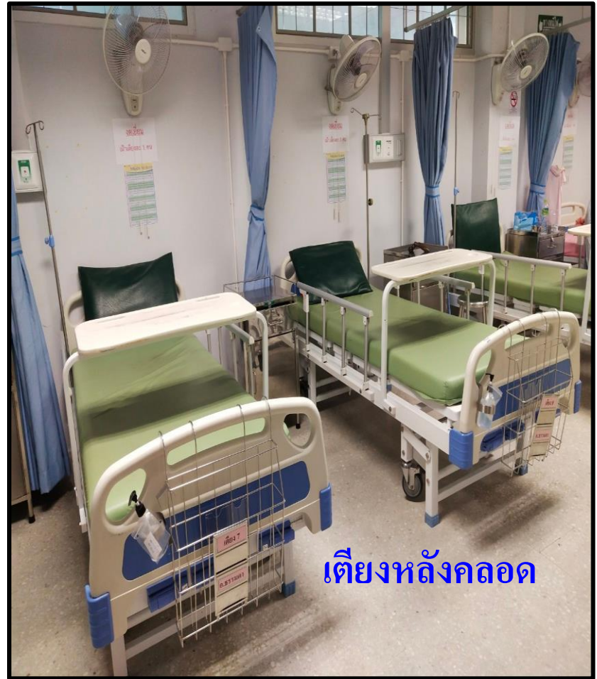
เตียงหลังคลอด