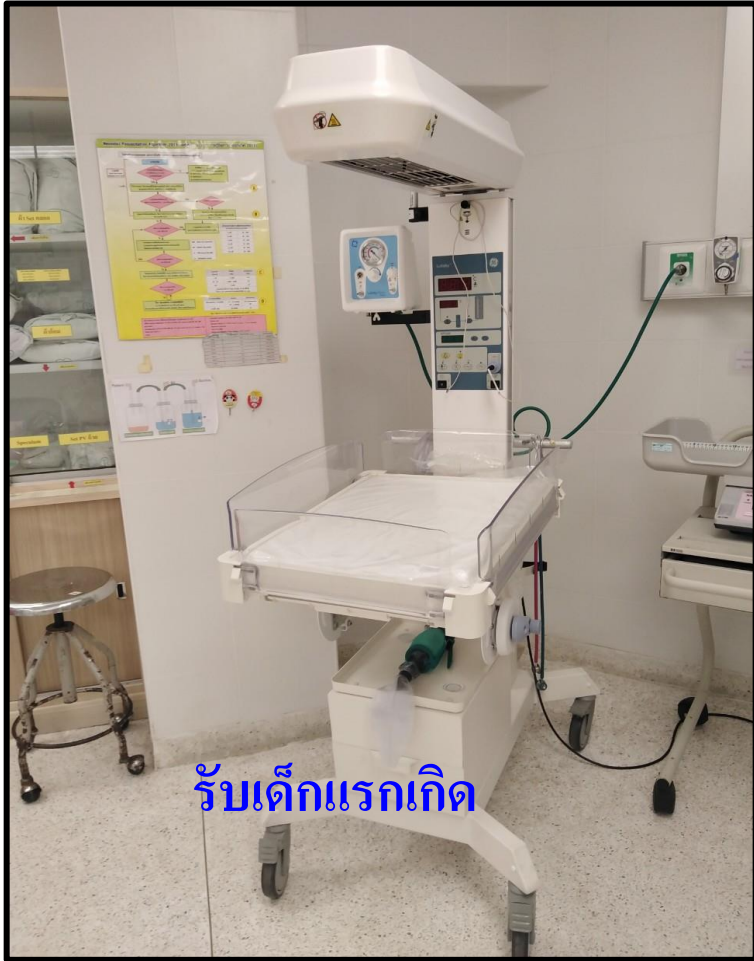
รับเด็กแรกเกิด